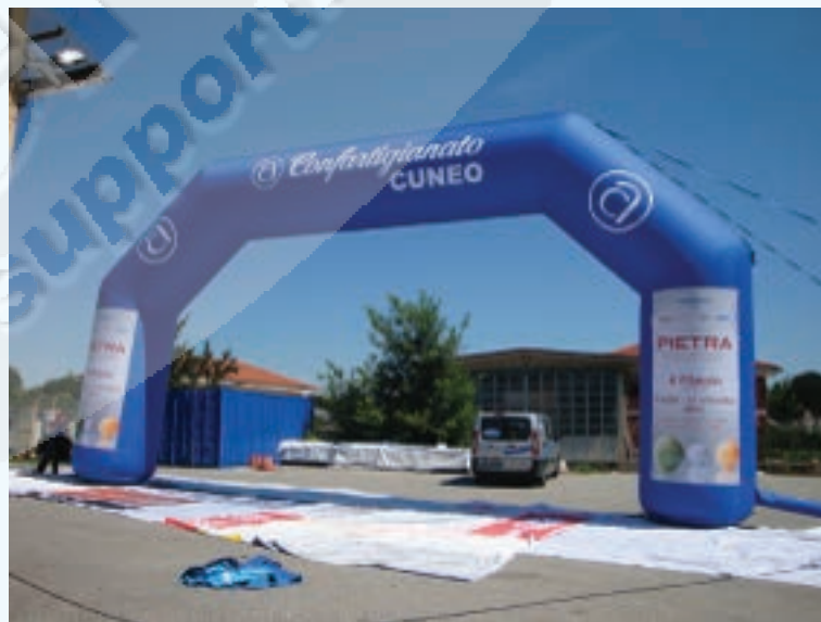
IMMAGINE DI ESEMPIO :

SPECIFICHE FILES PRONTO STAMPA : Formati accettati : .ai - .jpg - .pdf | Codifica colori : quadricromia (CMYK) | Risoluzione ottimale : scala 1:1 a 72 dpi