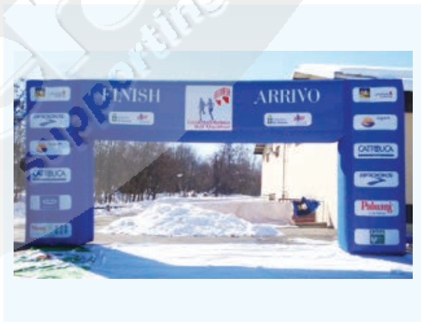
IMMAGINE DI ESEMPIO :