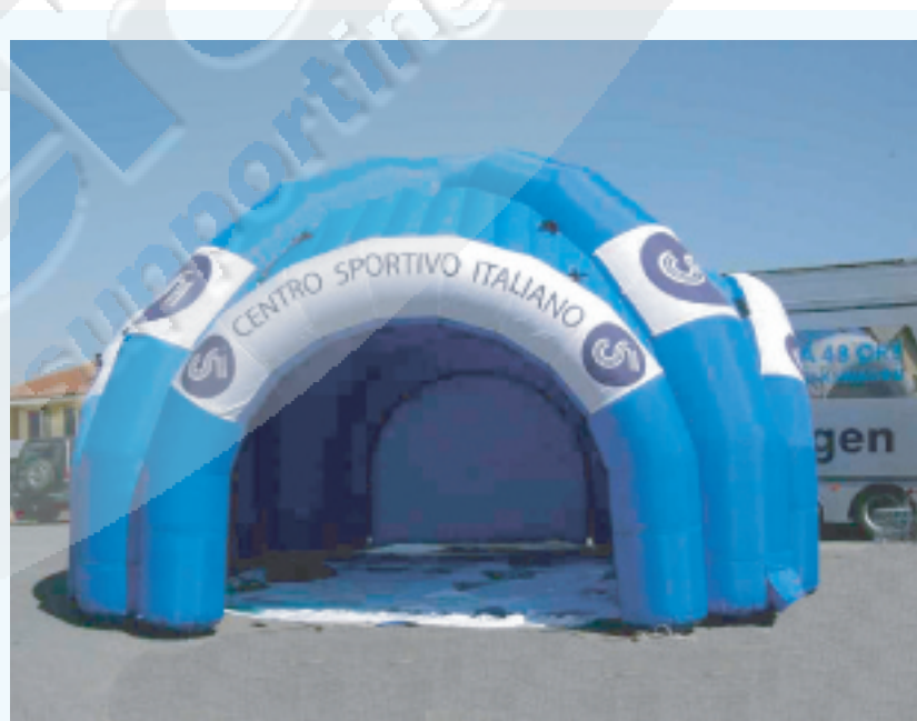
IMMAGINE DI ESEMPIO :